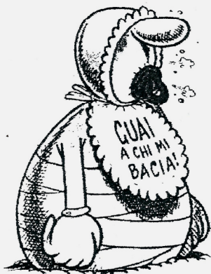
La neonata A.S.OLYMPIA

che, purtroppo, come genitori, conosciamo molto bene. gli ingredienti ci sono tutti, a cominciare dai dirigenti, tra i più noti imprenditori di Buccinasco, per continuare con gli allenatori, tra i più esperti e conosciuti tecnici di Milano.....e anche più in là, per finire con le giocatrici e i giocatori.....che siete voi, quindi una garanzia!!